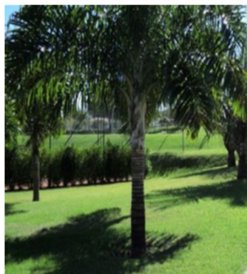
Areca de Locuba ( Dypsis madagascariensis )

Uma palmeira solitária, rústica e com muitas folhas, atinge uma altura com mais de 7 metros.